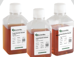
澳洲 乌拉圭 中国