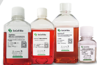
MSC增生 T细胞 CHO细胞 细胞冻存液